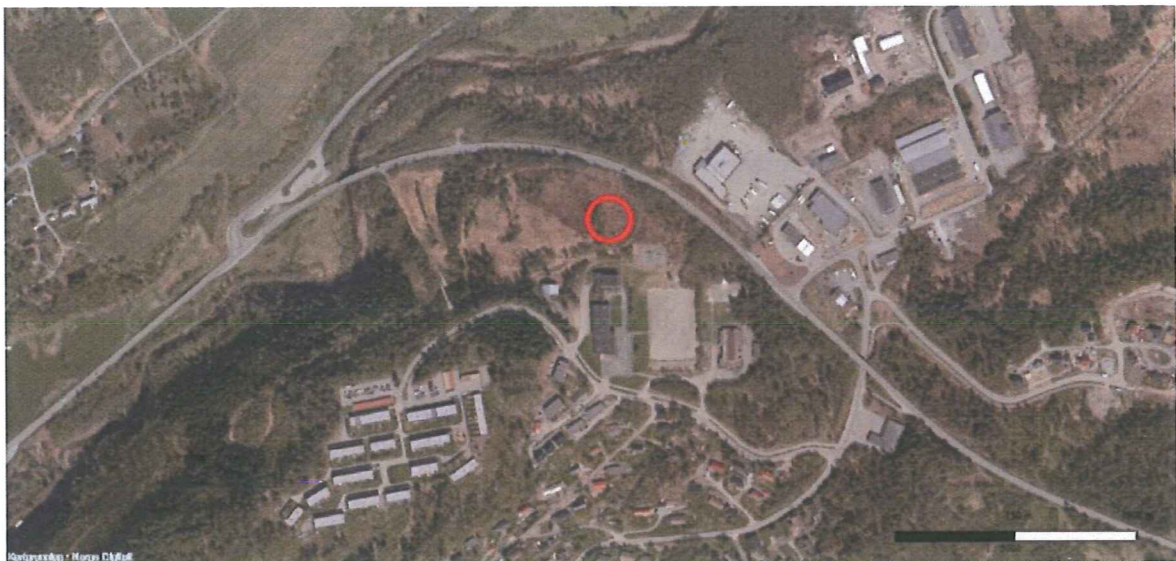
Flyfoto over Skjevika med idretts- og skoleområde