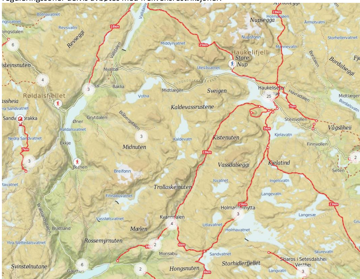
Figur 1: Turer og hytter i området – Ut.no

Det er mye aktivitet i området. Det er flere ting en kan vurdere, eksempelvis kan skjemmende reguleringssoner delvis avbøtes med frekvensrestriksjoner.